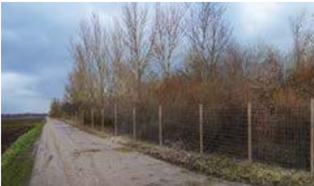
Photomontage de la vue depuis le chemin ouest