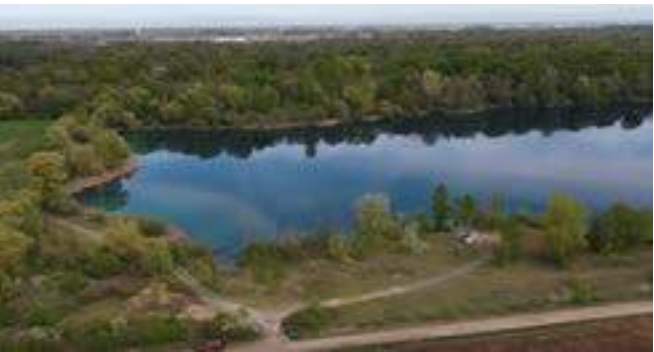
Vue aérienne de la zone réservée à l'activité de pêche

La préservation de l'activité de pêche a été intégrée dès la conception, avec la sanctuarisation d'une zone au nord du plan d'eau destinée aux pêcheurs. Des échanges se poursuivent pour accompagner l'AAPPMA dans l'aménagement de cet espace, notamment lors d'une réunion dédiée organisée le 9 octobre en mairie avec le président et plusieurs membres de l'association, aux côtés du Maire.