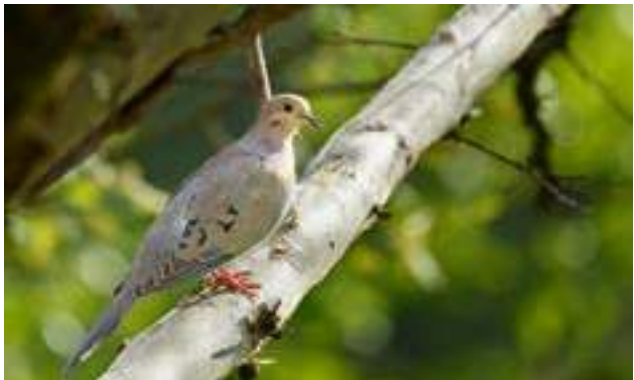
Photo d'une tourterelle des bois

Le projet s'implante sur le plan d'eau d'une ancienne gravière, dans un cadre visuellement cloisonné. Les préconisations portent sur les abords immédiats et les usages internes au site. Il convient de préserver la végétation périphérique et de la renforcer le long du chemin à l'ouest. La berge nord, végétalisée et accessible, doit être maintenue pour permettre des usages de loisir, notamment la pêche. Il est recommandé de reculer la centrale par rapport à cette berge afin de préserver le cadre renaturalisé et de limiter les perceptions depuis la route départementale. La zone de chantier et de mise à l'eau devra utiliser l'espace anthropisé au sud, en réduisant l'impact sur la végétation. Enfin, les locaux techniques seront de préférence implantés sur la berge sud, dans un secteur anthropisé éloigné de la route et des itinéraires pédestres.